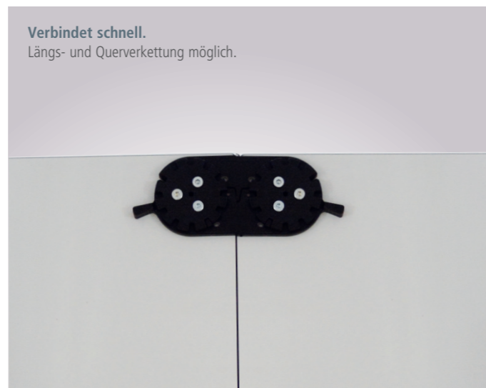
Verbindet schnell. Längs- und Querverkettung möglich.