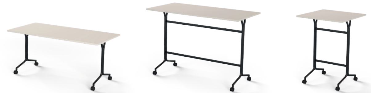
Rechtecktisch Stehtisch rechteckig Stehtisch quadratisch