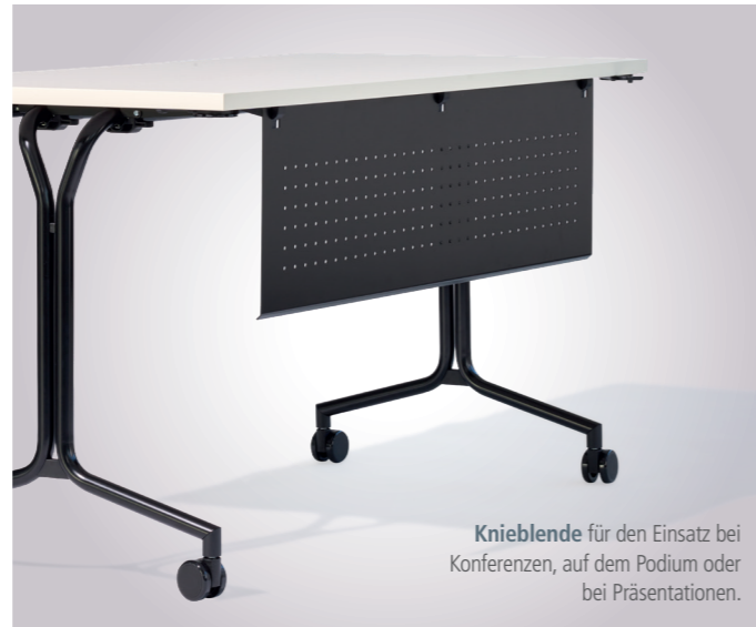
Knieblende für den Einsatz bei Konferenzen, auf dem Podium oder bei Präsentationen.