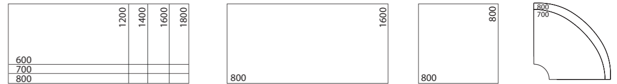
Rechtecktisch Stehtisch rechteckig Stehtisch quadratisch Eck-Einhängeplatte