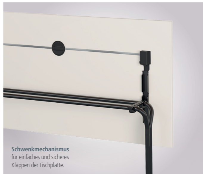
Schwenkmechanismus für einfaches und sicheres Klappen der Tischplatte.