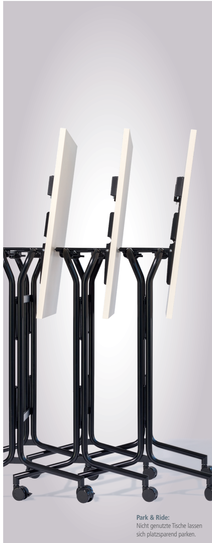
Park & Ride: Nicht genutzte Tische lassen sich platzsparend parken.